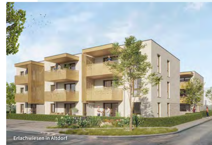
Erlachwiesen in Altdorf

Das neue Wohnquartier Seebachgärten in Schönaich umfasst 47 Eigentumswohnungen und 7 moderne Reihenhäuser. Gebaut werden Wohnungen mit 2 bis 4 Zimmern, jeweils mit Terrasse, Balkon oder Dachterrasse nach Süd-West ausgerichtet, sowie großzügige Reihenhäuser mit 4 Zimmern, eigenem Gartenanteil und Dachterrasse nach Westen. Die Größen reichen von 44 bis 120 Quadratmetern bei den Wohnungen und rund 125 Quadratmetern bei den Reihenhäusern. Alle Einheiten überzeugen durch hochwertige Ausstattung, lichtdurchflutete Räume und ein durchdachtes Energiekonzept. Komfortable Tiefgaragenstellplätze und gemeinschaftliche Grünflächen runden das familienfreundliche Quartier ab. Ruhig gelegen und dennoch zentral, bietet Schönaich eine hervorragende Anbindung an Böblingen und die Region Stuttgart.