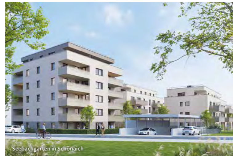
Seebachgärten in Schönaich