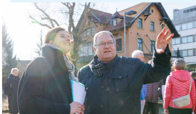
Öffentlicher Rundgang im Frühjahr.

Die Planung setzt auf eine offene Blockstruktur mit guter Durchlässigkeit, klaren Wegeachsen und Blickbeziehungen. Unterschiedliche Wohnformen schaffen einen vielfältigen Wohnungsmix, ergänzt durch private Gärten und gemeinschaftliche Höfe. Nachhaltigkeit spielt eine zentrale Rolle: Das Quartier soll geprägt sein von Grünflächen, Beeten und Baumarten, die gezielt zur Förderung der Biodiversität und zur Verbesserung des Stadtklimas beitragen. Das Konzept setzt zudem auf das Schwammstadtprinzip: Regenwasser soll teilweise dezentral bewirtschaftet werden und versickerungsfähige Beläge und Retentionsflächen die Versiegelung reduzieren.