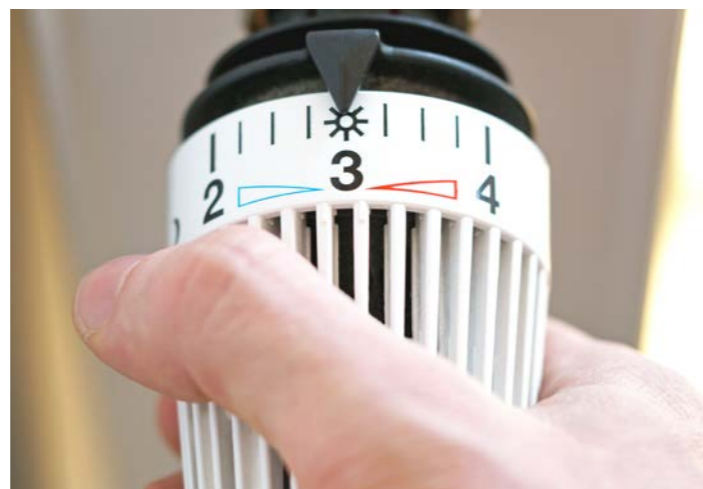
Dank Wärmepumpe vor dem Gebäude und Warmwasserspeicher im Keller kann die Umweltwärme nun zum Heizen genutzt werden. Bei anderen Gebäuden hat die BBG auch Dächer erneuert, Photovoltaik-Anlagen installiert und Bäder saniert.

In unseren vier Mehrfamilienhäusern in der Böblinger Achalmstraße haben wir ein ambitioniertes Ziel erreicht: die CO 2 -Emissionen der Gebäude deutlich zu senken. Dafür wurden in den vergangenen Monaten die alten Gasthermen durch ein innovatives Wärmepumpensystem ersetzt. Moderne Technik trifft hier auf durchdachte Planung: Eine Kombination aus Luft-Wasser-Wärmepumpen, Wasser-Wasser-Booster-Wärmepumpen und großzügigen Pufferspeichern sorgt für eine umweltfreundliche und effiziente Wärmeversorgung. Das System passt sich an die Außentemperaturen an und liefert zuverlässig Heizwärme und Warmwasser. Mit einer Leistung von bis zu 24 kW pro Haus und der Verwendung natürlicher Kältemittel setzt die Anlage neue Maßstäbe in Sachen Nachhaltigkeit.