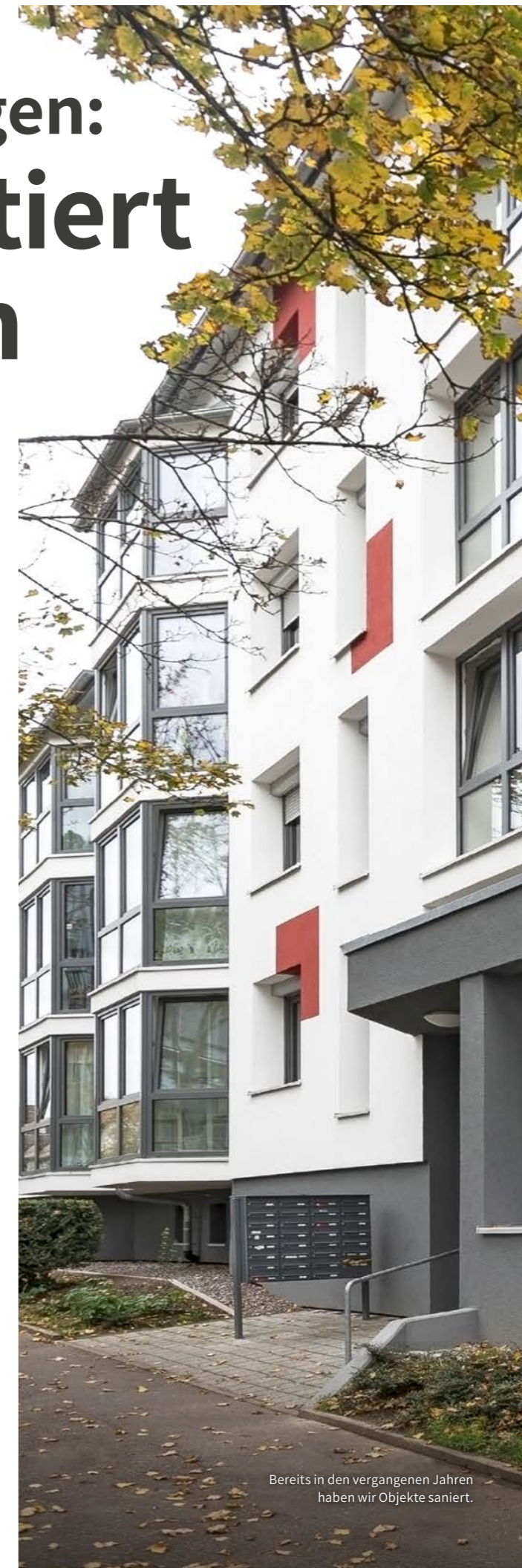
Bereits in den vergangenen Jahren haben wir Objekte saniert.

In unseren vier Mehrfamilienhäusern in der Böblinger Achalmstraße haben wir ein ambitioniertes Ziel erreicht: die CO 2 -Emissionen der Gebäude deutlich zu senken. Dafür wurden in den vergangenen Monaten die alten Gasthermen durch ein innovatives Wärmepumpensystem ersetzt. Moderne Technik trifft hier auf durchdachte Planung: Eine Kombination aus Luft-Wasser-Wärmepumpen, Wasser-Wasser-Booster-Wärmepumpen und großzügigen Pufferspeichern sorgt für eine umweltfreundliche und effiziente Wärmeversorgung. Das System passt sich an die Außentemperaturen an und liefert zuverlässig Heizwärme und Warmwasser. Mit einer Leistung von bis zu 24 kW pro Haus und der Verwendung natürlicher Kältemittel setzt die Anlage neue Maßstäbe in Sachen Nachhaltigkeit.