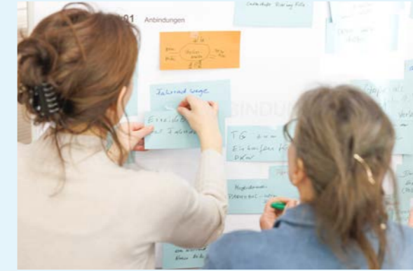
Der große Andrang zeigte das hohe Interesse der Bevölkerung an der Gestaltung Schönaichs.